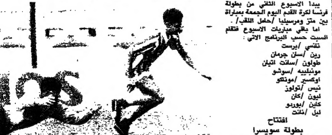
التهامج الالميركي جون الشريج يقام والفرس حوسبه غوتاليس ينده في سوبله اثناء تدريب فريق ريال سوسيداد الالميركي (روبيرت)

افتتاح بطولة دوري سويسرا لكرة القدم للموسم ١٩٨٩/٩٠ سجلت في اسبوعها الاول النتائج الآتية: غراس هوبرن/زوريخ ٢/١ لونغو/اسن على صفر/صفر سبون/لوسرن ١/٠ صفر يوغن بويز/توشيلتر ١/١ لوزان/سرفيت جينك ٢/٠ صفر ارون ايفينغن/١/٠ صفر سنة جديدة للمجر مع بورتو